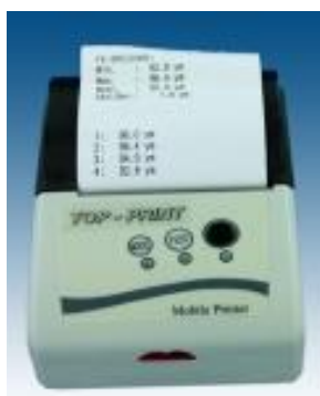
Termotlačiareň TOP - PRINT