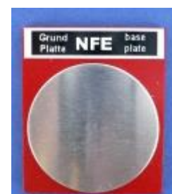
Kalibračné dosky FE a NFE